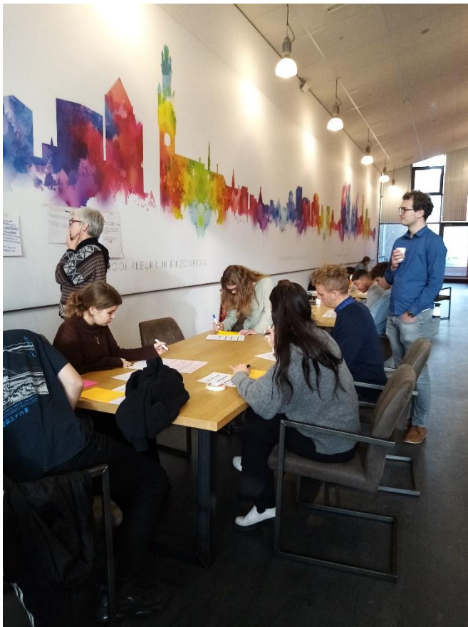
Transferbijeenkomst niveau 2

Lesgeven aan studenten die jonger zijn dan ik? Het ging eigenlijk vanzelf goed!