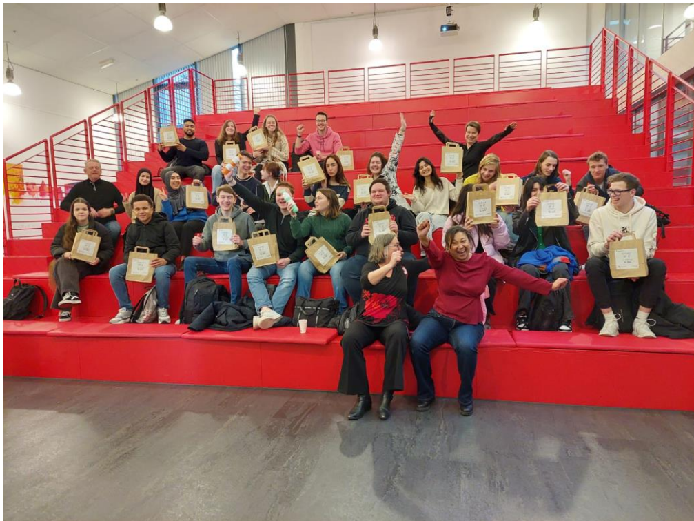
Kick Off Eerstejaars 6 februari 2023