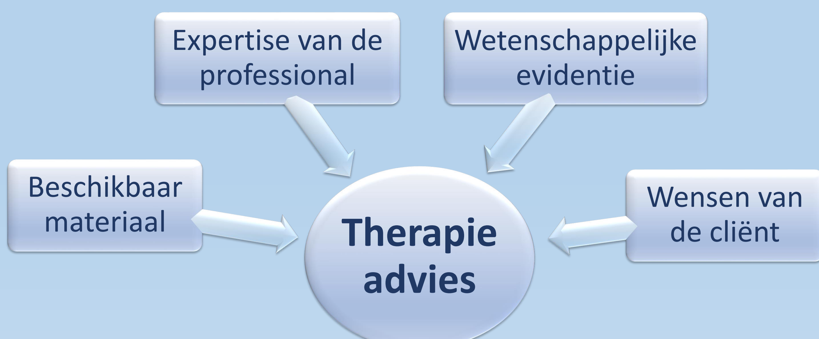
Figuur 2: factoren die het evidence based logopedisch handelen beïnvloeden.